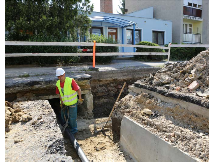
A projekt keretében az előregedett csöveket mind kicserélték.

A RÉGIÓHÓ Kft. által üzemeltetett távhőrendszerek korszerűsíté-