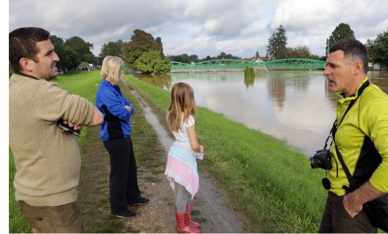
Szeptember 14-én 490 centiméteren tetőzött a Rába, harmadfokú volt a készültség.