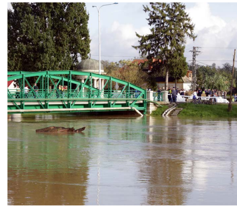
Az idén már ötödször áradt meg a Rába.