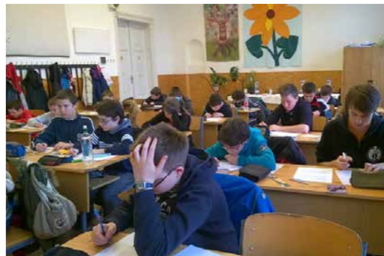
Környezetvédelemből a hulladékgazdálkodás, a megújuló energiaforrások volt a téma

kiemelt környezetvédelmi téma (idén: hulladékgazdálkodás, megújuló energiaforrások) képezi a verseny alapját. A 4 levelezős forduló után a területi döntő résztvevőinek elméleti feladatok megoldásán kívül egy kísérlet is el kellett végezniük és elemezniük.