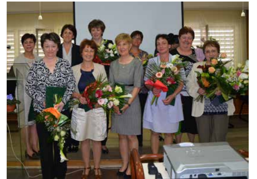
Sokan részesültek elismerésben a körmenti ünnepségen