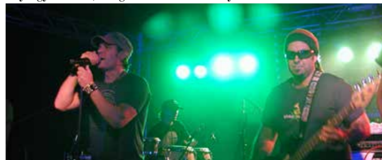
Az Ocho Macho – akárcsak a 30Y – idén mindkét fesztiválon fellép

Fellépők: Vad Futtki, 30Y, Kiscsillag, Péterfy Bori & Love Band, Anna and the Barbies, Heaven Street Seven (a Nyugat-Dunántúlon itt utoljára!), Depresszió, Ossian, Lord, Pál Uteai Fiúk, PASO, Alvin és a Mókások, Ismerős Arcok, Supernem, FISH!, Ivan and the Parazol, Ocho Macho, Magashegyi Un-