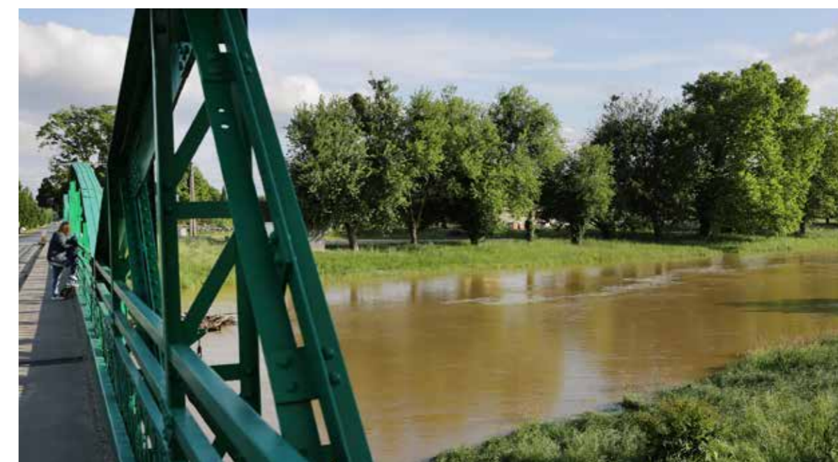
A napokban árhullám vonult le a Rábán a nagy esőzés miatt, de ezúttal nem okozott gondot