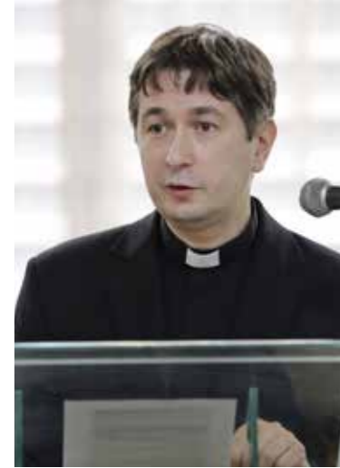
Képünkön az előadó

Azt is érdemes lenne átvenni a kanadai katolikusoktól, hogy jól használják a tulajdonukban lévő médiumokat, a püspökök bátran állást foglalnak társadalmi kérdésekben, az állami ünnepek is imádsággal kezdődnek és fejeződnek, és ez a pártrendezvényeken is van, ahová lelkészeket is gyakran meghívunk. Az Istenről való beszéd része a hét-