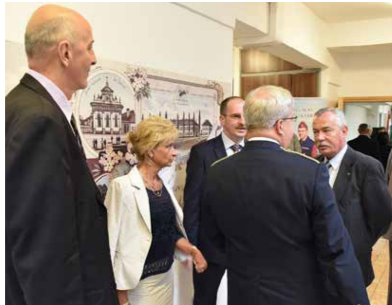
A konferencia szünetében nosztalgizhattak is egy kicsit a résztvevők