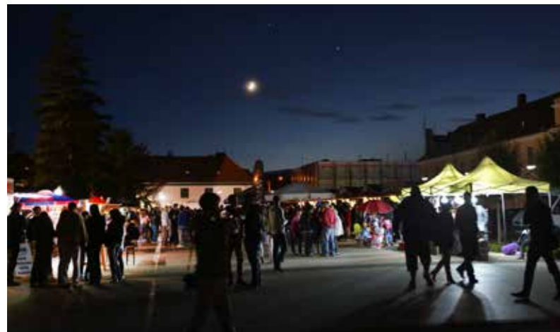
Holdsarlót hímált az ég a Szabadság téren