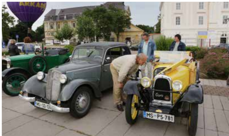
Oldtimer bemutató is volt ezen a napon