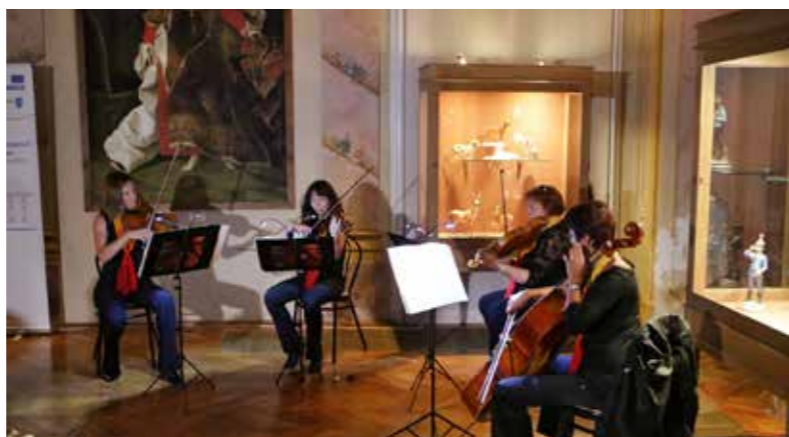
Hangulatos koncertet adott az Isis Quartet

A várva várt lampionos felvonulás elmaradt, volt viszont hőlégballonozás, ami egy igazán izgalmas program-elemnek számított. Az Isis Quartet koncertje a nap fénypontja volt, ezt az időjárás miatt nem a Várkertben, hanem a Díszteremben tartották, a hangzás gyönyörű volt.