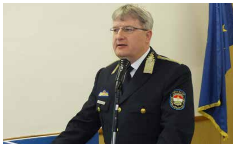
Dr. Halmosi Zolt vezérőrnagy méltatta a hatékony munkát, közte a körmenyi eredményes tevékenységét

Hangsúlyozva: a számadatok alakulásában a megelőző tevékenység szerepe is óriási. Az országos programok – mint a „MegÓVlak”, a „D.A.D.A.”, az „Ellen-Szer”, a „LeSZERellek” – mellett a megyei kezdeményezésű „Ki mit tud?” tehetségkutató az óvodás korosztálytól kezdve egészen a középiskolásokig szólítja meg az érintetteket és hívja fel a figyelmüket a korosztályukat leginkább érintő veszélyekre és az áldozattá válás megelőzésének lehetőségeire. Tavaly mintegy négyezer vasi középiskolás diák részvételével kábítószer-prevenációs oktatásban. Jellemzőek az időskorúak sérelmére elkövetett vagyon elleni bűncselekmények is. Ennek megakadályozása érdekében már a megye öt településén, köztük Körmenyben, elindult a kortárssegítő program. Az idősek klubjában, a képviselő-testületi üléseken rendszeresen megtartott figyelemfelhívó előadások mind-mind a jogsértések megelőzését célozzák. A rendészeti szakterületet értékelve elmondták, hogy a 2013. évhez viszonyítva emelkedett ugyan a közlekedési