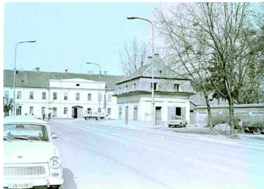
A korona épülete a régi taxiállomással

A Tóth László által készített felvételek döntő része körömenti eseményeket, pillanatokat vagy helyszíneket örökít meg, de nagy számban vannak fotók a járásból is, például egy viszáki rönkházról a hetvenes évekből vagy egy disznóölésről, de érdekesek azok a fényképek is, amik még régebben készültek, még azelőtt, hogy Tóth László a könyvtárba került volna. A hatvanas években készültek például lánképek az evangélikus templom tornyából, olyan panorámák, amelyek a mai ember számára szinte megdöbbentőek: egész városrészek hiányoznak még. De óriási a látványbeli különbség ak-