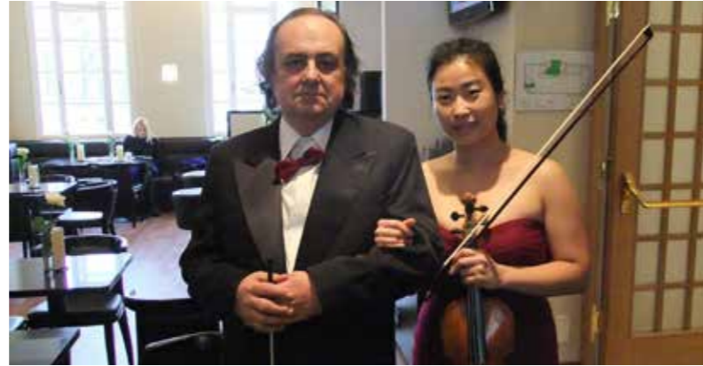
Rózsa Ferenc karnagy egy nagyszerű bécsi koncert után a kolléganőjével

– Nézd, nekem mindig is nagyon fontos volt a hazai pálya, mert magyar vagyok. Állom és vallom azt, hogy ez a kis ország hihetetlen kulturális kincsekkel bír, amelyeket fel kell kutatni és közkincsé tenni. Igyekszem sokat tenni ezért, olyan ritka operákat kutattam fel, mint a Ciro Pinsuti : Mattia Corvino (Mátyás király), amelynek első teljes előadása éppen Mátyás szülővárosában, Kolozsvárt történt meg 2008-ban és az irányítással. Felku-