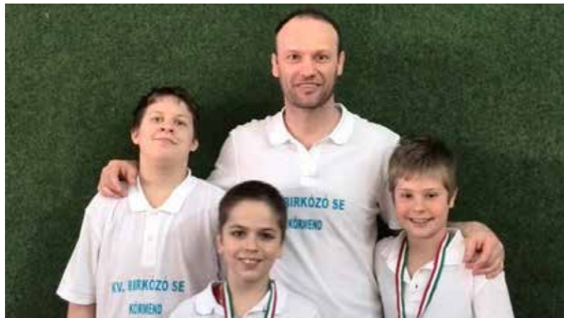
A körmei birkózók jól szerepeltek Kőszegen