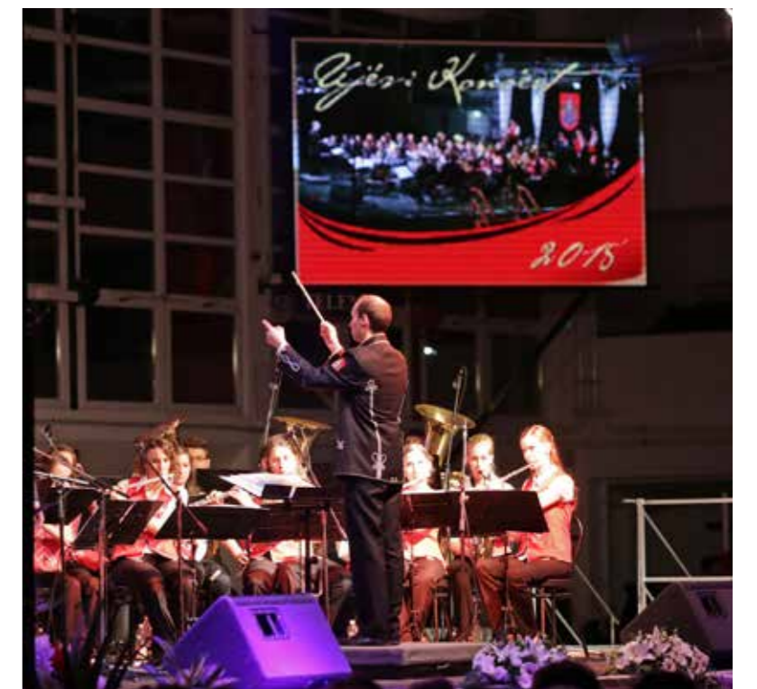
Idén is lesz pénz a nagyrendezvényekre