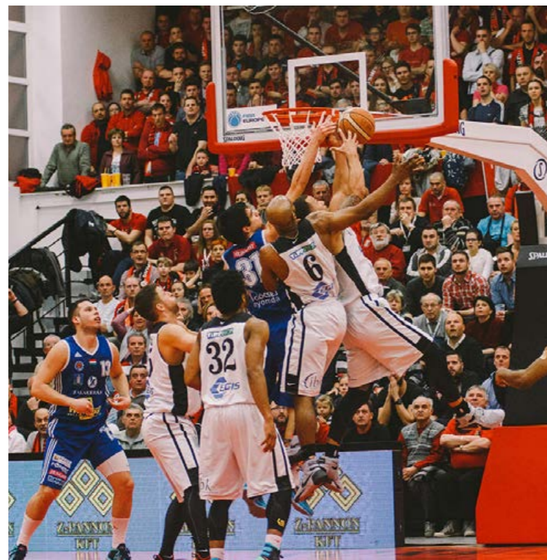
Támadásban az Egis Körmend a ZTE ellen

vendégek újra belőtték magukat, állandósult a tíz pont körüli fölényük. Nekünk semmi sem sikerült a támadásban, ellenben ők mindig tudtak újítani. Három és fél perc volt hátra, amikor áttértünk letámadásra. Látszott, hogy az Egis nem adta fel. Egy 10:0-s sorozattal feljöttünk egészen négy pontig, de