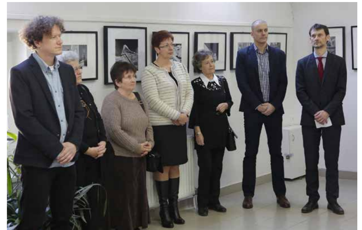
A kiállítás megnyitóra a diákokon kívül eljöttek a barátok, hozzátartozók